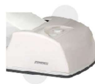
CAIXA DE LIGAÇÃO INTEGRADA