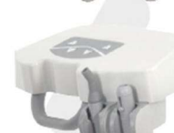
BRAÇO ALCANCE COM PAD CONTROL*