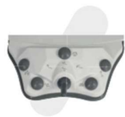
PEDAL MODELO JOYSTICK