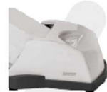
CAIXA DE LIGAÇÃO INTEGRADA