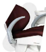
BRAÇO DE APOIO DO PACIENTE REBATÍVEL