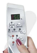
SISTEMA DE MASSAGEM*