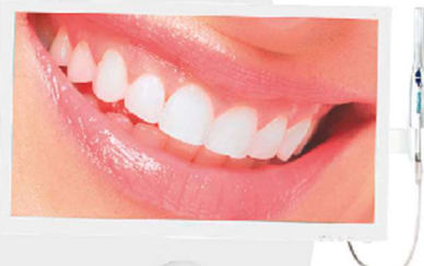
KIT MULTIMÍDIA (OPCIONAL)