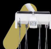
EQUIPO COM ATÉ 06 TERMINAIS