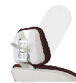
ENCOSTO DE CABEÇA BIARTICULADO