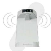
UNIDADE DE ÁGUA COM PORTA COPOS E SENSOR DE PROXIMIDADE