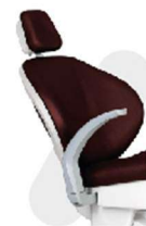
AMPLO ESTOFAMENTO COM MAIS DE 22 OPÇÕES DE CORES