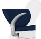
BRAÇO DE APOIO DO PACIENTE REBATÍVEL