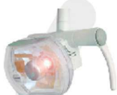
REFLETOR PERSUS LED*