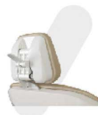
ENCOSTO DE CABEÇA BIARTICULADO