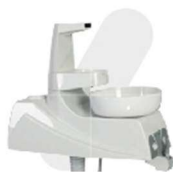
UNIDADE DE ÁGUA REBATÍVEL 90°