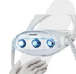
REFLETOR LED COM SENSOR DE PROXIMIDADE