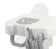
BRAÇO ALCANCE COM PAD CONTROL*