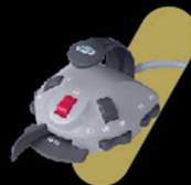
PEDAL CHIP BLOWER