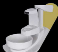
UNIDADE DE ÁGUA COM SENSOR DE PROXIMIDADE