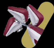
ENCOSTO MULTIARTICULADO COM TRAVA PNEUMÁTICA