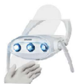
REFLETOR LED COM SENSOR DE PROXIMIDADE*