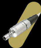
MICROMOTOR ELÉTRICO DE SÉRIE