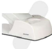
CAIXA DE LIGAÇÃO INTEGRADA