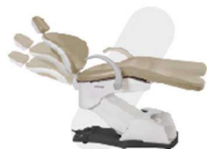
CADEIRA COM MOVIMENTO DE TREDELENBURG