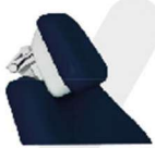
ENCOSTO DE CABEÇA BIARTICULADO