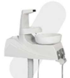
UNIDADE DE ÁGUA REBATÍVEL 90°