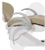
BRAÇO DE APOIO DO PACIENTE COM SISTEMA DE TRAVA PNEUMÁTICA