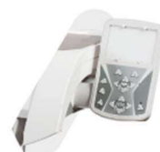
PAD CONTROL COM NEGATOSCÓPIO NO EQUIPO